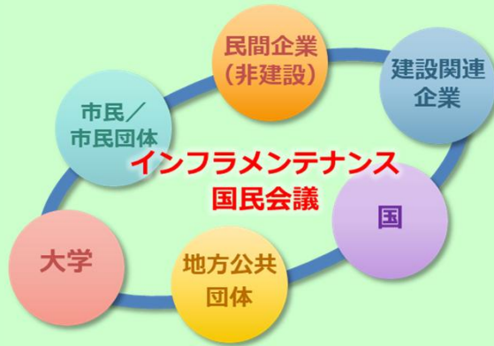
国民会議参加会員数（者）