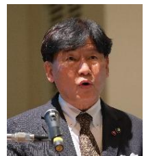
中部ブロック幹事 豊川市長 竹本 幸夫