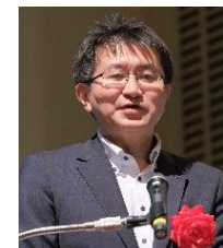
国土交通省 技監 廣瀬 昌由