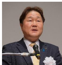
代表幹事 稲城市長 高橋 勝浩