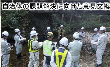
自治体の課題解決に向けた意見交換