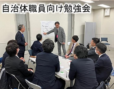
自治体職員向け勉強会