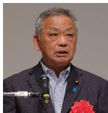
国土交通副大臣 高橋 克法