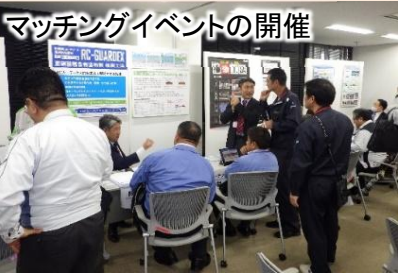
マッチングイベントの開催