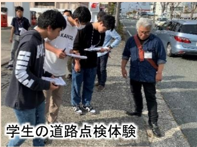
学生の道路点検体験