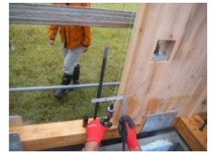
基礎部の施工の様子