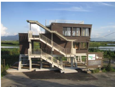
【木造化】「雁晴れ舎（福島潟鳥獣保護区管理棟。新潟市北区にある鳥類の観察ステーション。）」