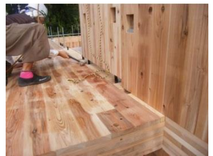
建て方作業の様子