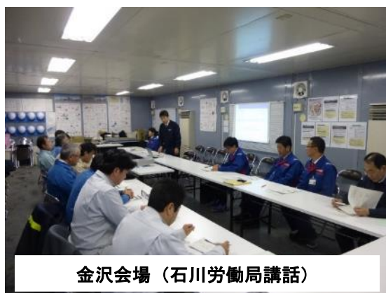
金沢会場（石川労働局講話）

参加者からは、女性安全パトロールの実施や AED（自動体外式除細動器）を常備する等の取組みを紹介して頂きました。それらに対する質問や意見が多数出てきて、有意義な意見交換が出来ました。