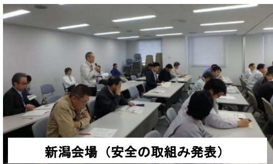
新潟会場（安全の取組み発表）

北陸地方整備局発注の直轄工事における工事事故・労働災害・公衆災害の発生状況の分析と、冬期の雪による労働災害の現状について紹介しました。