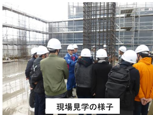
現場見学会の様子

金沢営繕事務所では、公共建築月間のイベントの一環として、平成29年11月16日に金沢科学技術専門学校の建築学科1年生の生徒36名を招いて、石川運輸支局新築工事の現場見学会及び意見交換を行いました。意見交換会は、事前にアンケートにより専門学校生が抱えている工事現場のイメージを把握してから行い、工事現場の魅力を深め、建設業界の担い手確保と育成を目的に開催しました。