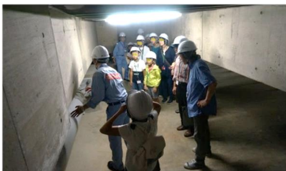
免震装置の説明を聞く子供たち

参加した子供たちは、免震装置やモニター画面など、目を輝かせながら庁舎内を探検していました。