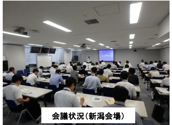
会議状況(新潟会場)

平成28年5月に新たな政府実行計画が閣議決定され、温室効果ガスの総排出量を2013年度を基準として2030年度までに40%削減を目標とする計画について、新潟地区は関東地方環境事務所、富山、石川地区については、中部地方環境事務所の担当者より説明をしていただきました。