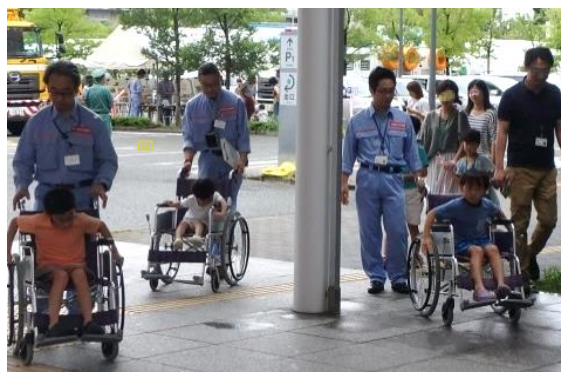
子供たちが車いすを体験

参加した子供たちは、車いすを操作して、普段の生活では気づきにくい障害の多さや、通行しやすくするための工夫などを、体感していただきました。