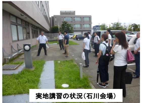
実地講習の状況(石川会場)