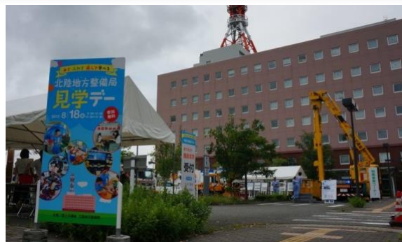
「見学デー」は、昨年に引き続き2回目の開催

当日は、快晴とはいかなかったものの、昨年を上回る約500名の方が来場し、庁舎内の見学や体験学習に参加していただきました。