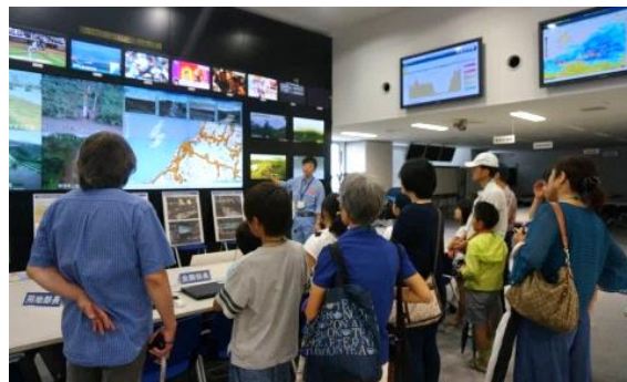
災害対策室のモニターに興味津々