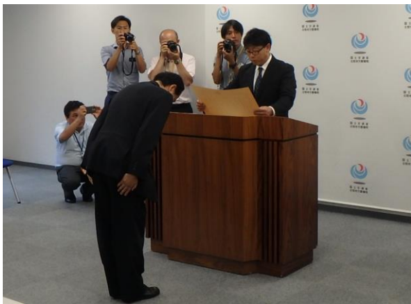
営繕部長表彰授与式(7月20日)