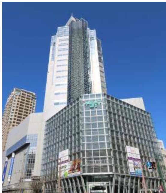
中央区役所が入ったNEXT21の外観 (パスポートセンター、まちなかほっとショップ、運転免許センター古町出張所などを併設)