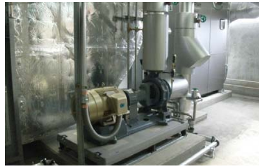
新潟港湾合同(12)空調設備改修工事