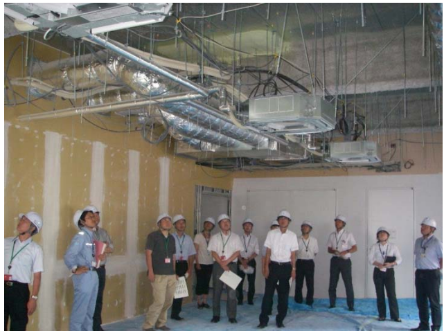
開催状況（新潟地区 保全実地研修）

営繕部及び金沢営繕事務所からの情報提供として、平成25年4月に制定された「官庁施設の津波防災診断指針」、「建築保全業務共通仕様書（平成25年版）」等の基準類について説明しました。