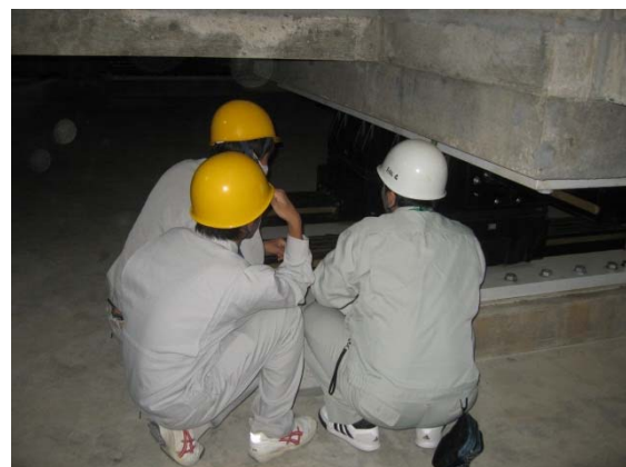
免震装置見学状況