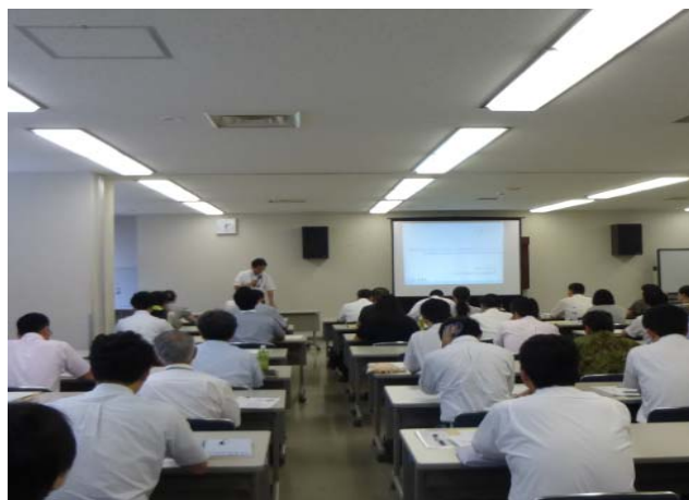
開催状況（石川・富山地区）