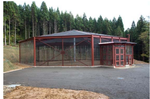
飼育ケージ棟外観

飼育ケージはトキが将来的に野生で生活できるようにすることを目的として、飛翔や採餌、休息ができるような施設としています。内部は飛翔に支障がでないよう概ね円形に近い八角形（26m×26m）の平面形としており、天井までは5～8mの高さを確保しています。