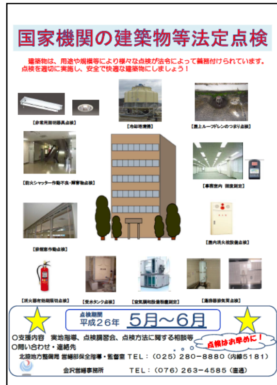
キャンペーンポスター

簡易に作成可能となった「年度保全計画書」の演習を行い、施設管理者自らによる各施設の年度保全計画書の作成を促しました。