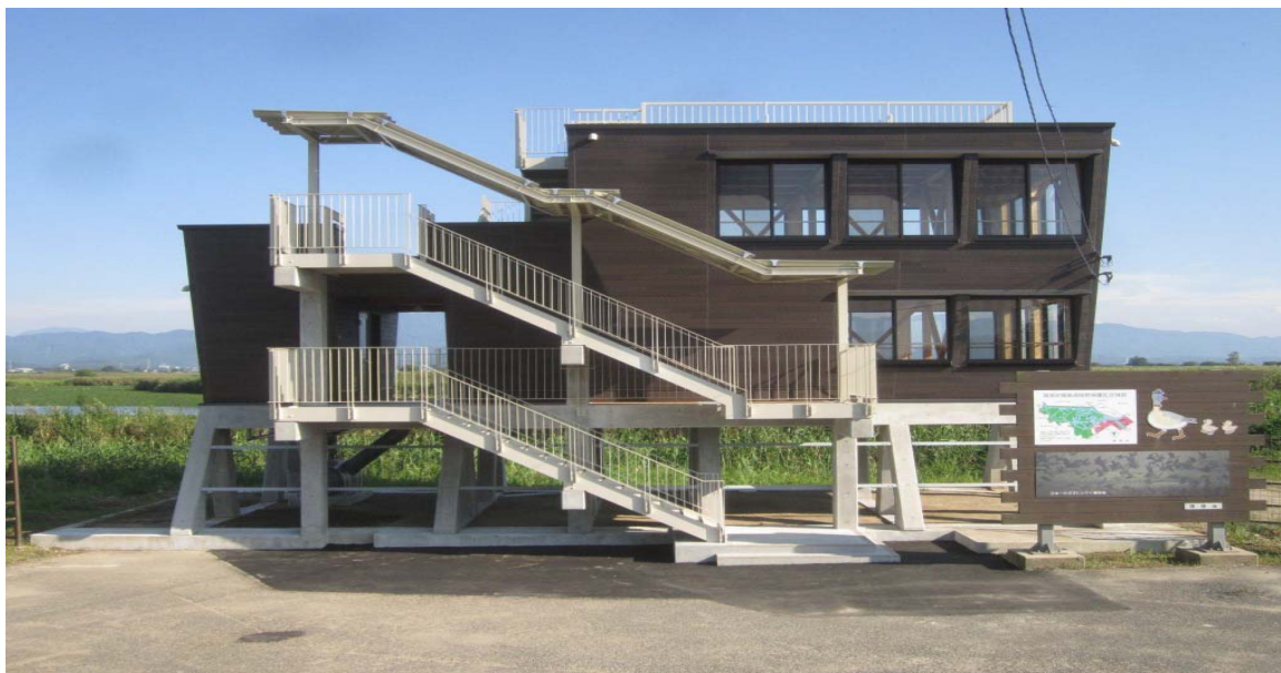
福島潟鳥獣保護区管理観察棟

福島潟は新潟市北区に位置し、天然記念物のオオヒシクイをはじめとする220種類以上の渡り鳥や、450種類以上の水生・湿性植物などが確認されている国指定の鳥獣保護区です。今回、建て替え整備した福島潟鳥獣保護区管理観察棟（通称「雁晴れ舎」。平成26年9月12日オープン。）は、その区域内の湖畔に建つ無人の施設で、地域の小学生等の課外活動での使用や、バードウォッチャーに親しまれています。浸水対応の高床式、傾斜壁を持つ特徴的な外観に加え、北陸地整では公共建築物等における木材の利用の促進に関する法律施行以降、初の木造施設となります。