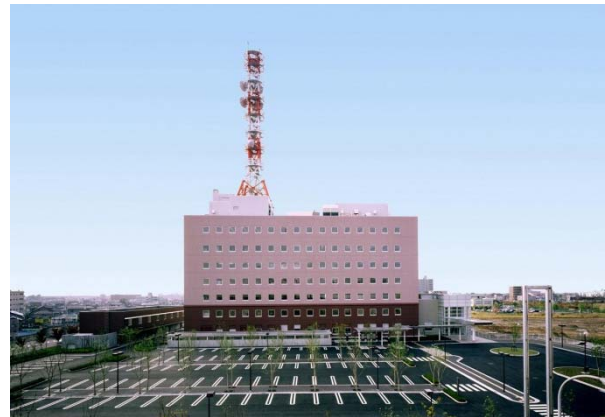
新潟美咲合同庁舎 1号館全景

生徒は説明者からこの建物の重量が約1万6,000トンあり、この重量を40個の免震装置で支えているなどの説明を受けながら、はじめて見る免震装置に実際に触れ、説明者に質問をしたり、メモを取ったりしながら興味深そうに見ていました。