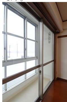
ベランダ(サンルーム)

南魚沼市という豪雪地に立地することから、共用廊下やベランダにも建具を設け、冬でも風雪がしのげるように配慮した設計となっています。