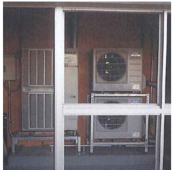
パッケージ形空気調和機の設置状況

発表では、本研究対象施設の工事概要や、実際に機器設置後の機器効率の低下を抑制するために行った創意工夫について説明しました。