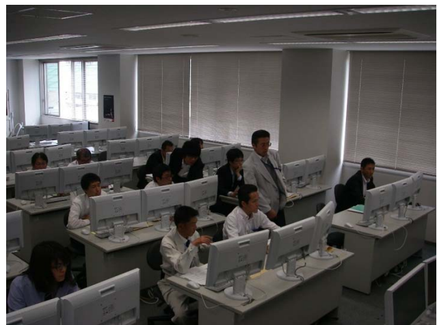
開催状況(石川地区)