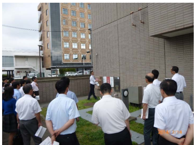
開催状況（石川・富山地区 保全実地研修）