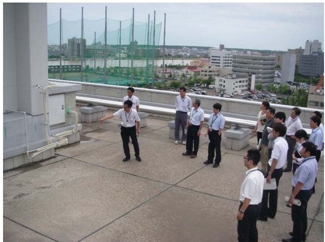
開催状況（新潟地区 保全実地研修）