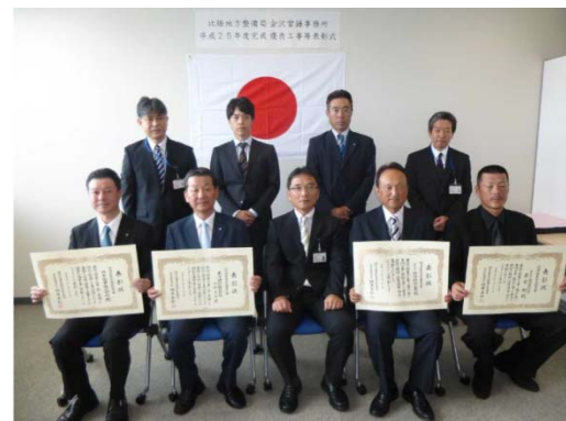
金沢営繕事務所長表彰