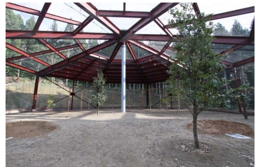
飼育ケージ棟内観