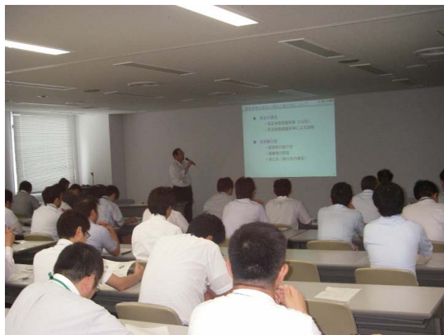
開催状況（新潟地区）

法定点検の実施にあたり、点検項目、点検対象、点検周期、点検方法、支障の有無及び支障の内容をまとめた「法定点検チェックシート」を使って、各年度の点検の実施及び点検結果を保存するシートとして活用するよう、改めて周知しました。また、保全実地講習を昨年度同様実施し、新潟地区では新潟美咲合同庁舎1号館をモデルに、石川・富山地区では金沢駅西合同庁舎をモデルに建物内外を巡回しながら、点検・確認対象部位における点検のポイントや、点検・確認記録表及び点検マニュアルの記入方法を説明しました。