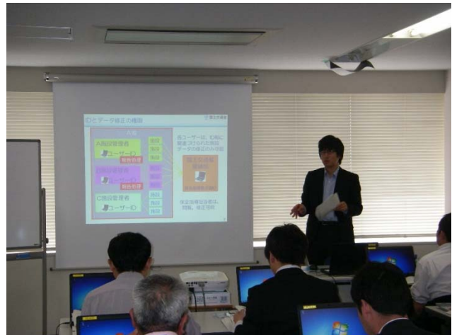
開催状況(新潟地区)

また、建築物の維持管理を怠ったことが原因とみられる事故事例・裁判事例の紹介、施設管理者が背負う責任について説明しました。