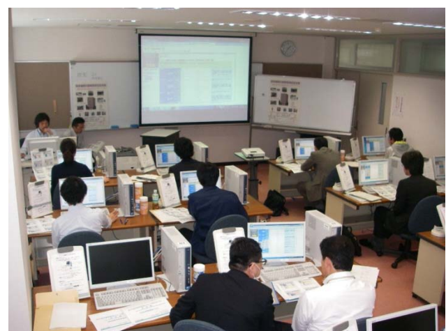
開催状況(富山地区)

※ BIMMS-N : Building Information system for Maintenance and Management Support in National government.