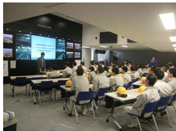
免震層装置説明状況