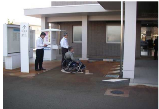
車いす利用の方の診断の様子