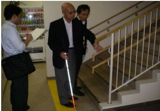
視覚障がいをお持ちの方の診断の様子

本庁舎が運用を開始して1年半が経過し、今回改めて実際に利用者の実感に基づく意見をいただき（UD診断）、本庁舎の運営管理や今後の施設整備に活かしていくこととしました。