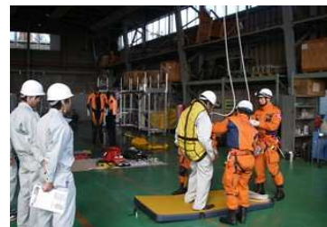
実際に訓練を体験している状況