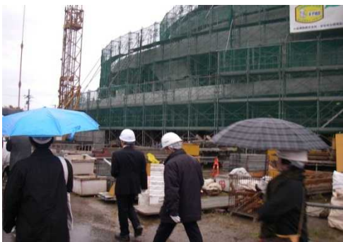
合同現場見学（(仮称)新津文化会館）