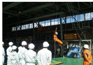
海難救助の訓練を見学している状況