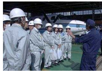
飛行機を見学している状況