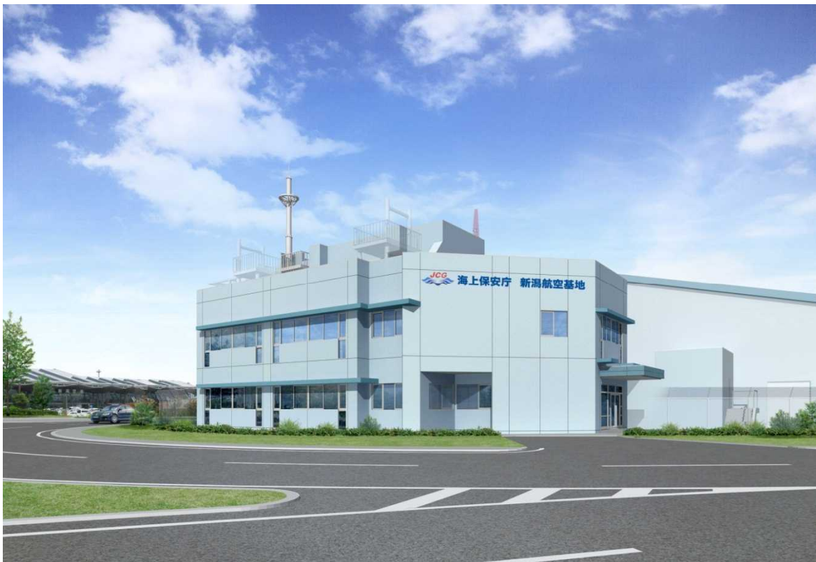
新潟航空基地（パース）