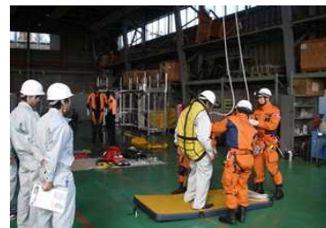
実際に訓練を体験している状況