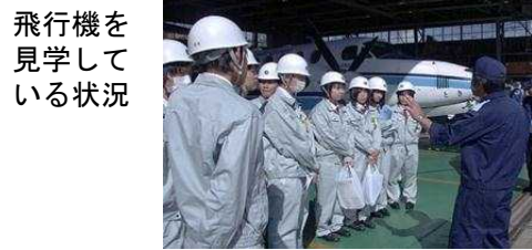
飛行機を見学している状況