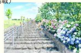
▲既存施設のリニューアル（あじさい園）のイメージ