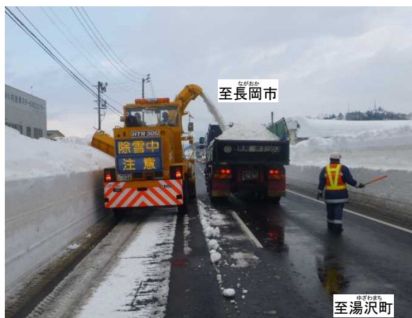
現道区間における運搬排雪作業状況 (令和3年1月撮影)