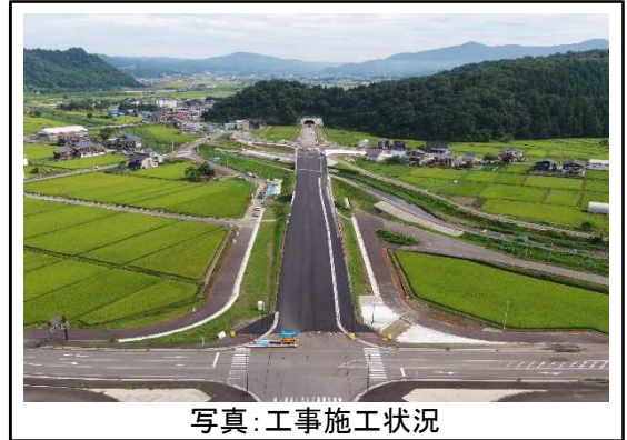
写真：工事施工状況