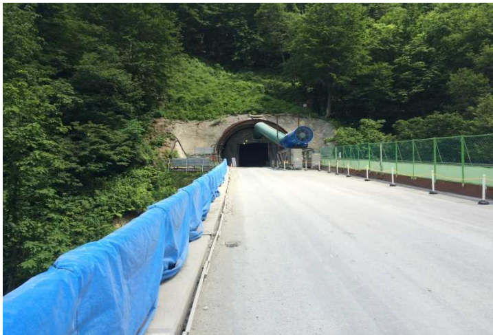
6号トンネル坑口(新潟側) 撮影日H28.6.8