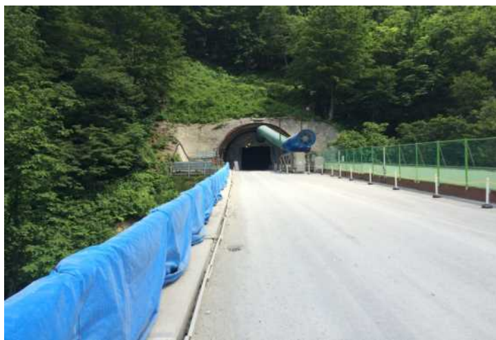
6号トンネル坑口(新潟側) 撮影日H28.6.8