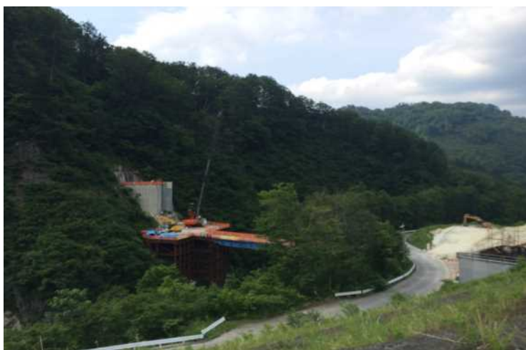
5号橋梁 P1・P2橋脚 撮影日H28.6.8