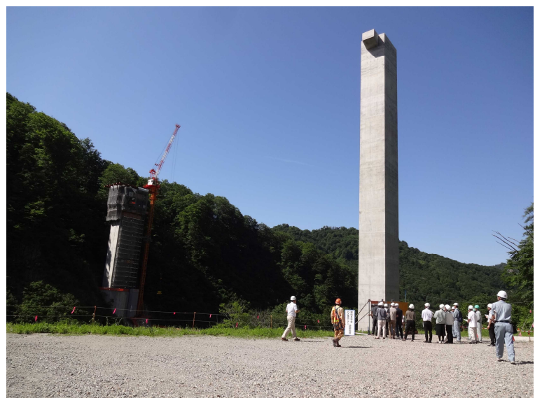
5号橋梁 P1・P2橋脚 R1. 5撮影