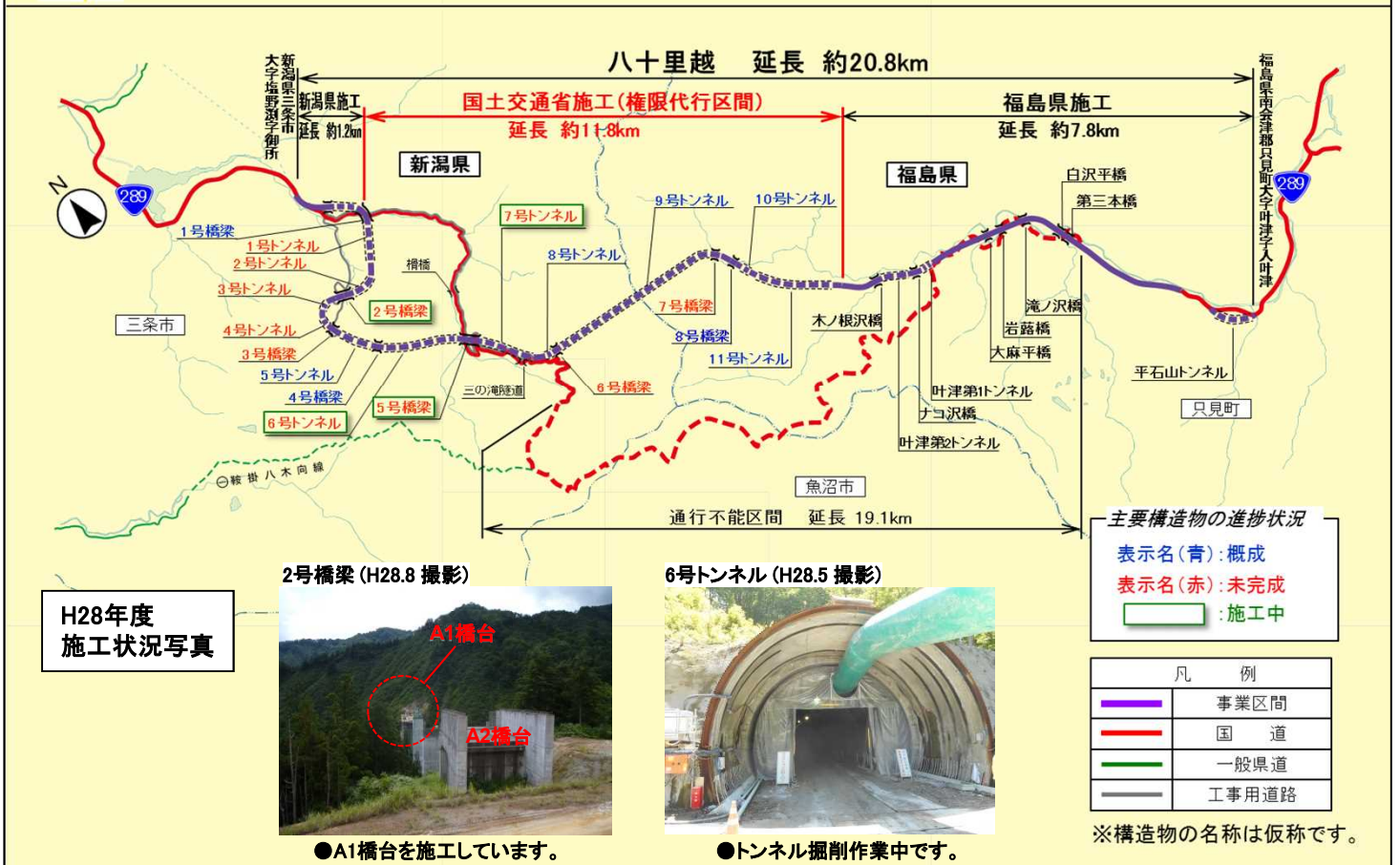
H28年度 施工状況写真