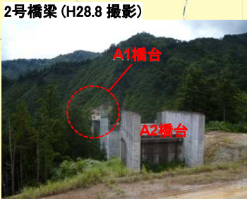
●A1橋台を施工しています。