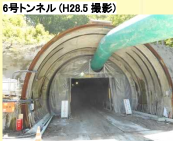
●トンネル掘削作業中です。