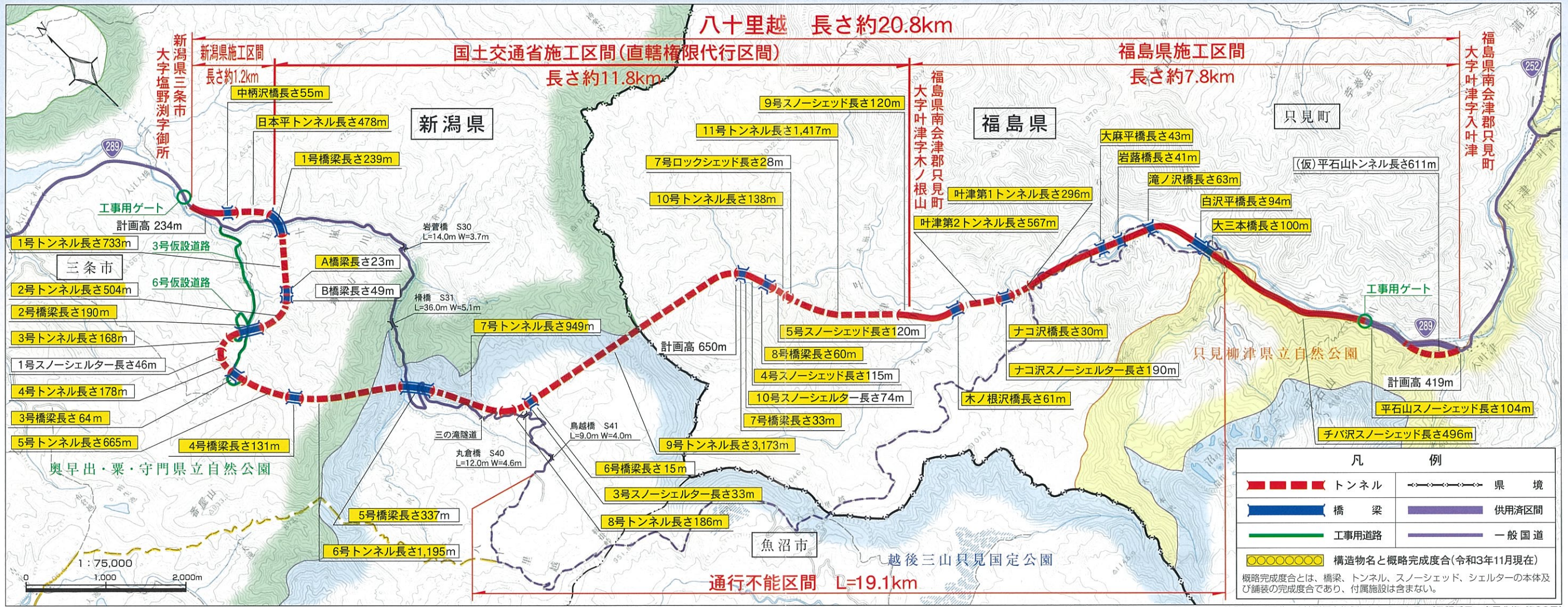
この地図は、国土地理院長の承認を得て、同院発行の5万分の1地形図を複製したものである。(承認番号 令元北復、第23号)