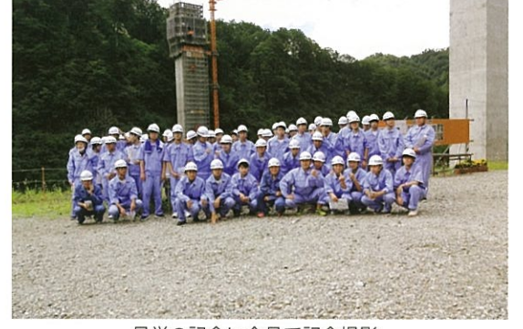
見学の記念に全員で記念撮影。