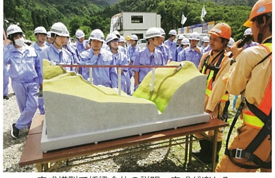
完成模型で橋梁全体の説明、完成が楽しみ。