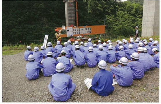
現場事務所 橋脚橋梁工事の説明。

7月4日、塩沢商工高等学校の1年生64名が、八十里越の大規模橋梁工事の工事現場を見学しました。この見学会は、北陸建設業界の担い手確保・育成に関する取り組みとして実施したものです。当日は、建設現場で事業概要、橋脚橋梁工事の説明、コンクリートのスランプ試験の実習を生徒が行い工事担当者から具体的な施工方法等の説明を受けました。生徒は、熱心に説明を聞き、積極的に質問をしていました。