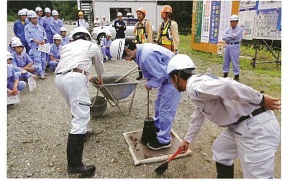
コンクリートのスランプ試験に挑戦です、設計値に入るかな。