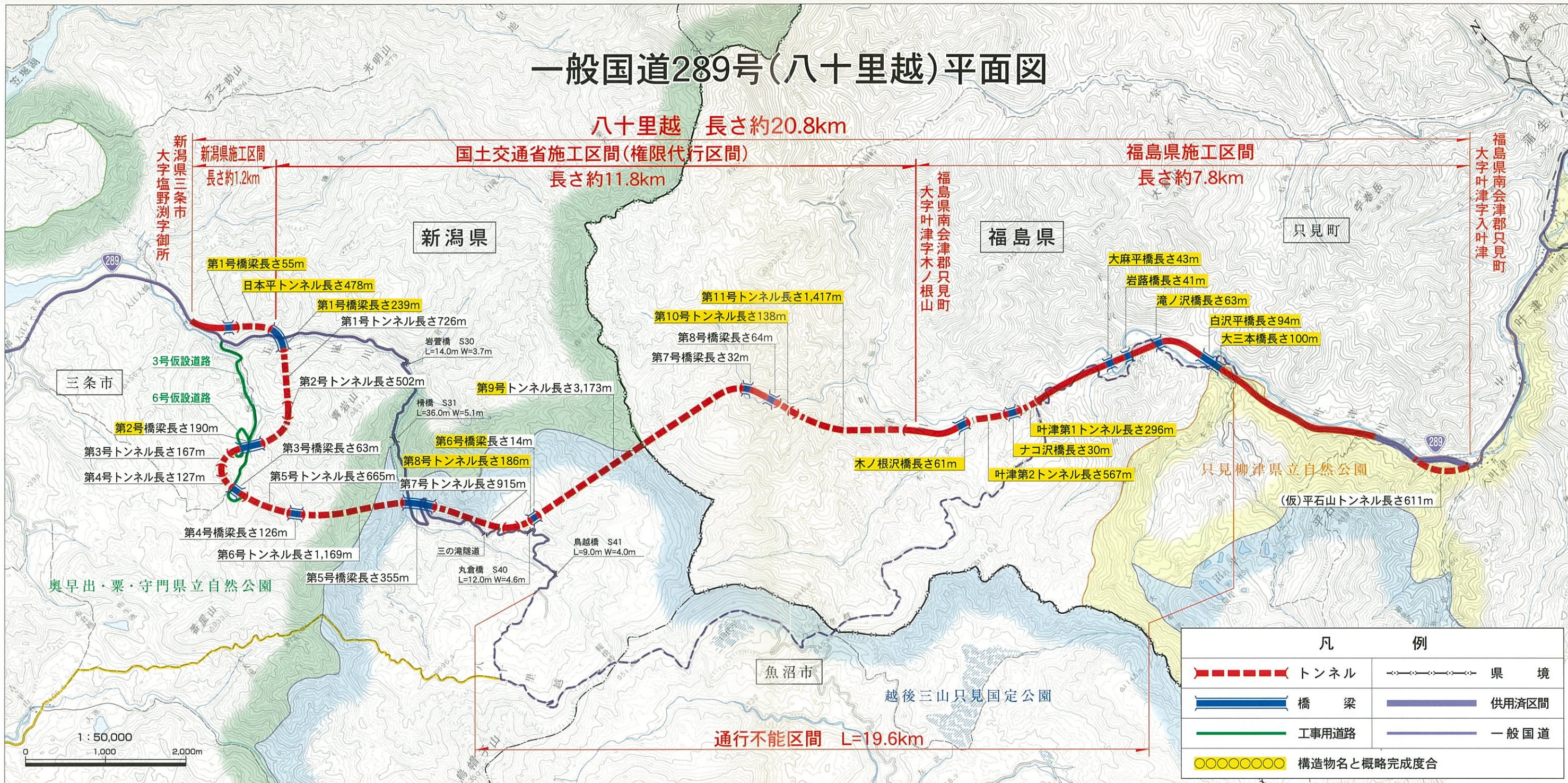
この地図は、国土地理院発行の5万分の1地形図を複製したものである。