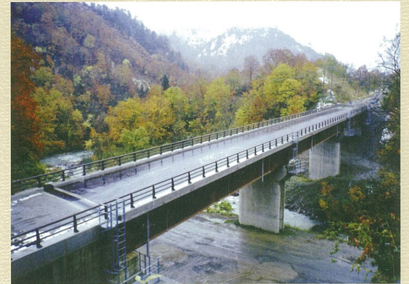
雪と紅葉をバックに完成を迎えた大三本橋 撮影 平成14年11月

福島県では、7つの橋を作る予定です。6橋目の完成となる大三本橋が、今年の11月に完成しました。福島県側の工事の中では、最も長い99.7mの橋です。雪解けを待ち工場から運んできた橋の桁は、約5ヶ月で現場に架けました。