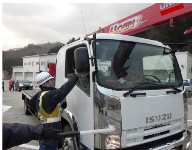
冬期注意喚起啓蒙活動状況