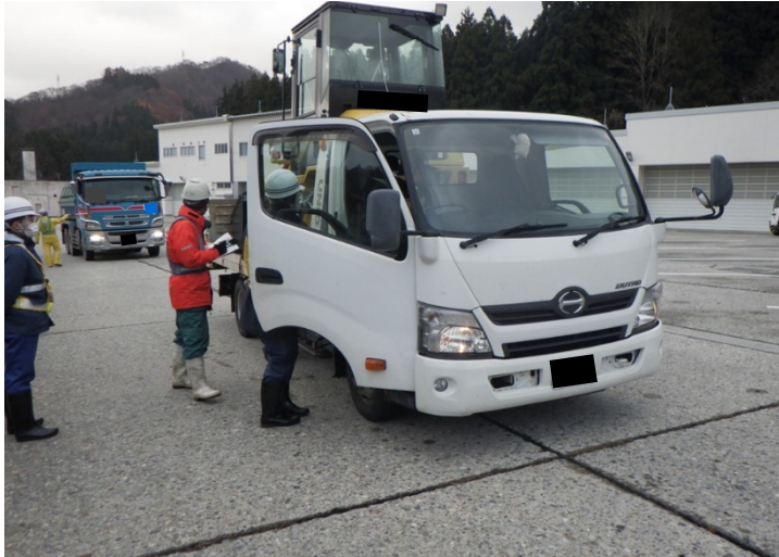
冬期注意喚起啓蒙活動状況