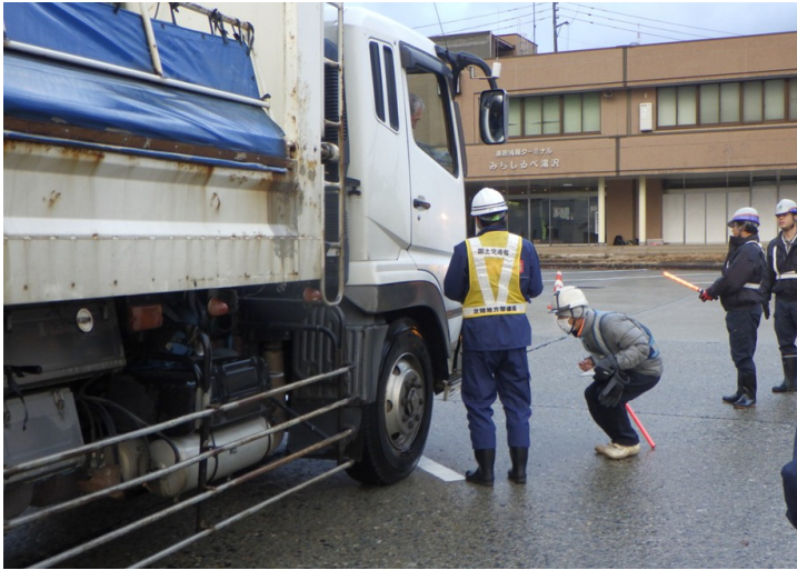
冬用タイヤ装着確認状況