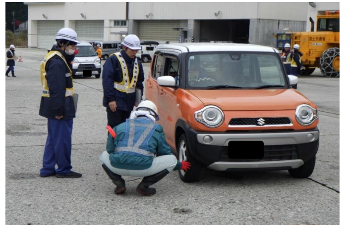
冬用タイヤ装着確認状況