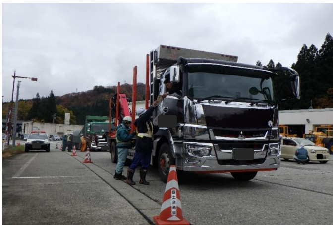
冬期注意喚起啓蒙活動状況