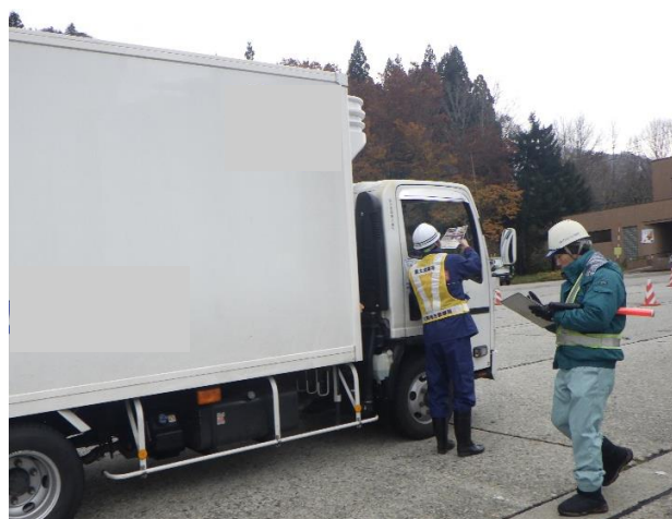
冬期注意喚起啓蒙活動状況