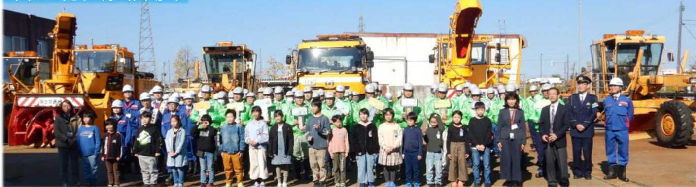
令和5年度の除雪出動式