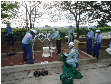
【非常用トイレの組み立て】 各団体ごとに非常用トイレの組み立て方法を確認し、 設営訓練を実施