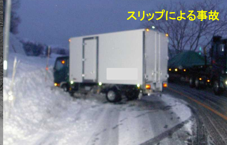
スリップによる事故