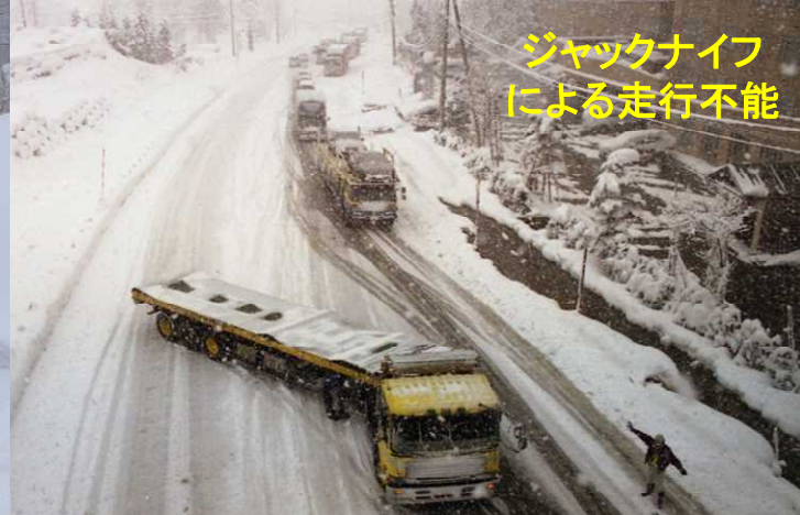
ジャックナイフ による走行不能