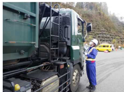
チェーン装着啓発活動(R4/11/29)