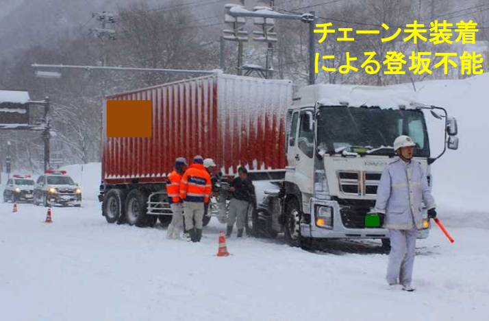
チェーン未装着 による登坂不能