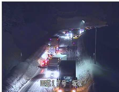
登坂不能車による交通障害(H30/2/12)