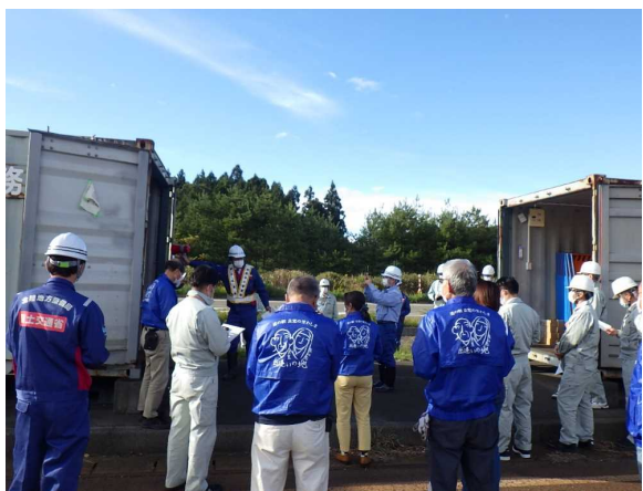
【災害用保管資材の確認】 保管庫の資材をリスト表と照合し点検