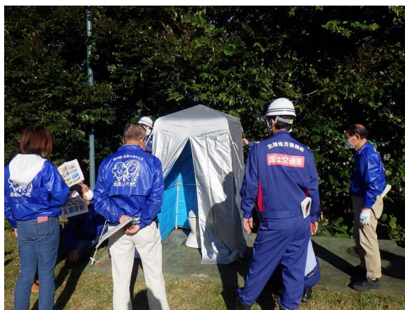
【非常用トイレの組み立て】 非常用トイレの組み立て方法を確認し、設営訓練を実施