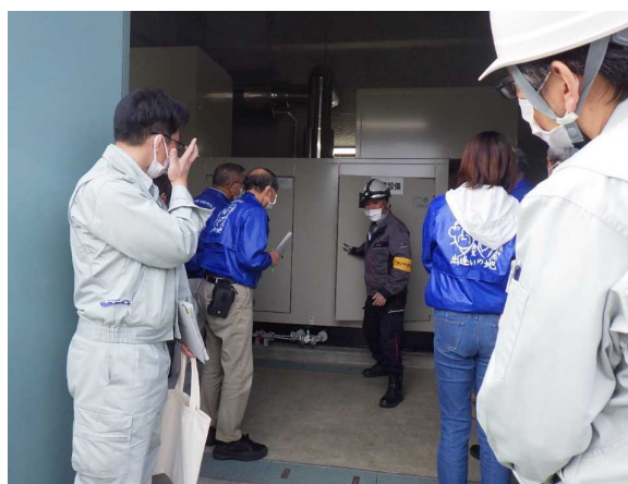
【非常電源用発電機の説明】 長岡国道事務所職員による 非常電源用発電機の起動操作の説明