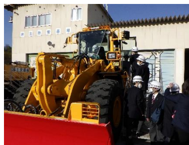
除雪機械への体験乗車