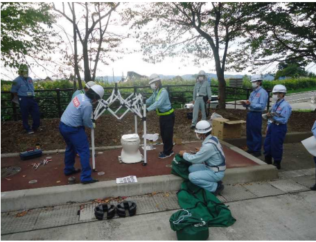
【非常用トイレの組み立て】