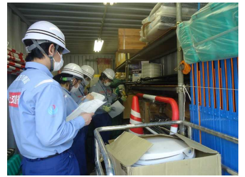
【災害用保管資材の確認】