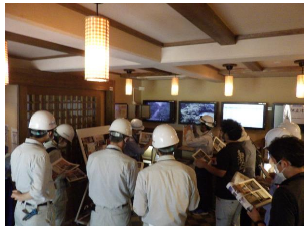
【衛星通信施設の取り扱い確認】 衛星通信施設の使用法、注意点の確認