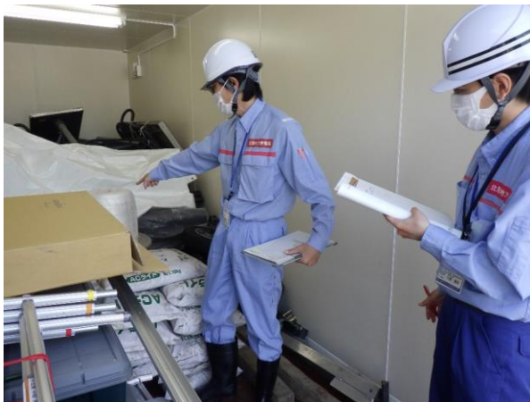
【災害用保管資材の確認】 備蓄倉庫の資材をリスト表と照合し点検