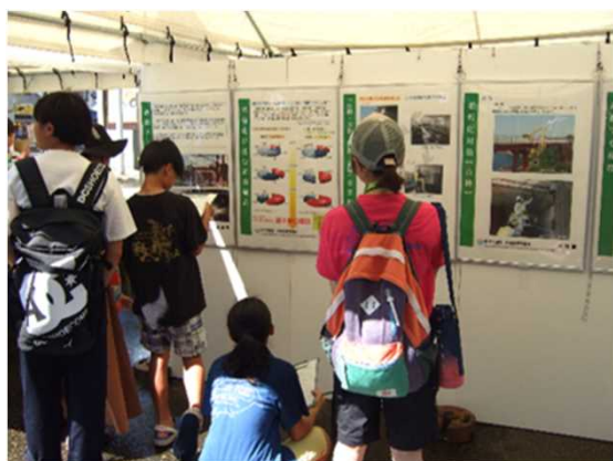
「パネル展示コーナー」(令和元年の様子)