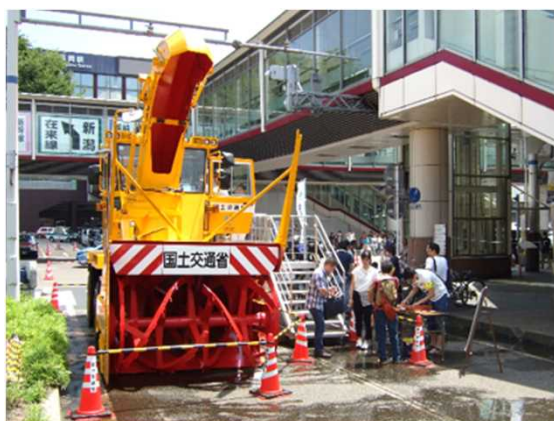
「ロータリ除雪車」展示・試乗(令和元年の様子)