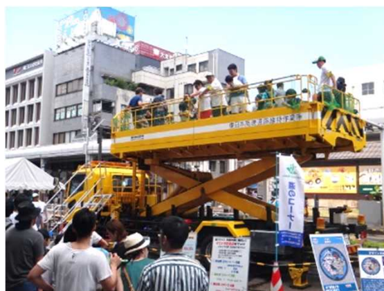
「高所作業車」展示・試乗(令和元年の様子)

会場では、新型コロナウイルス感染症の拡大を防止するための基本的な対策の実施にご協力ください。