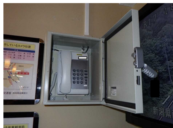
【衛星通信施設の取扱い確認】 衛星通信施設の使用方法、注意点の確認