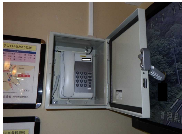
【衛星通信施設の取り扱い確認】 衛星通信施設の使用方法、注意点の確認