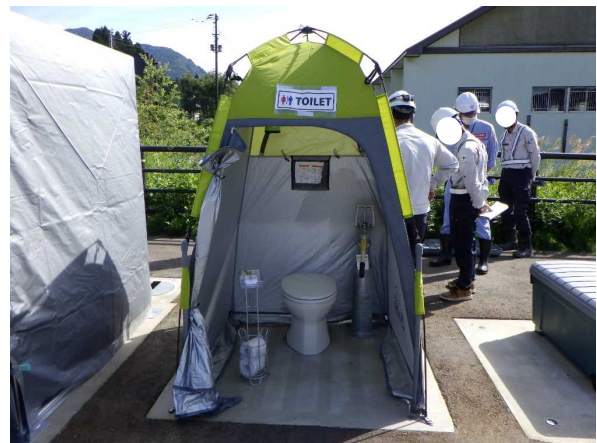
【非常用トイレの組み立て】 非常用トイレの組み立て方法を確認し、設営訓練を実施