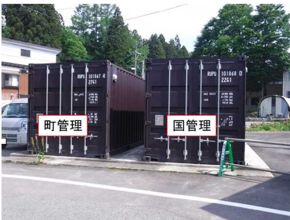
【災害用保管資材の確認】 備蓄倉庫の資材をリスト表と照合し点検