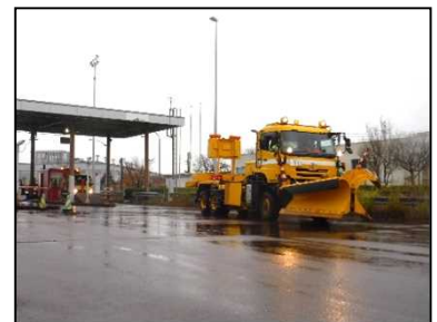
訓練状況(R1.12.3) 【北陸自動車道 中之島・見附IC】