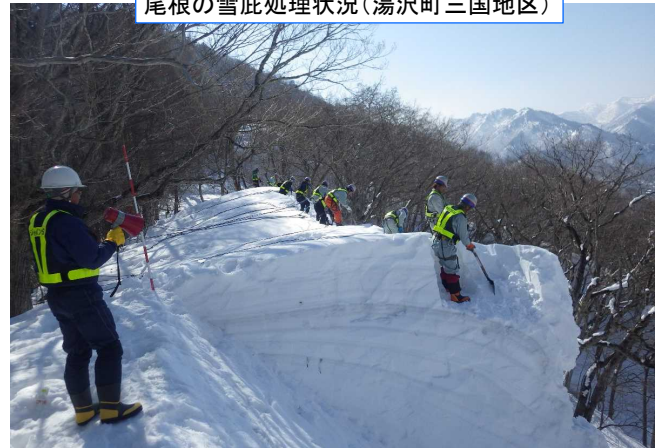
尾根の雪庇処理状況(湯沢町三国地区)