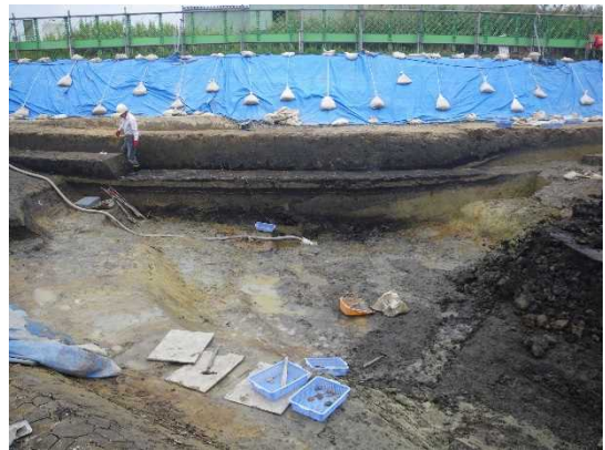
弥生～古墳時代・古代の川の様子