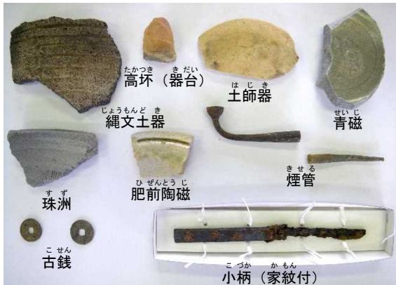
調査区内から出土した主な遺物