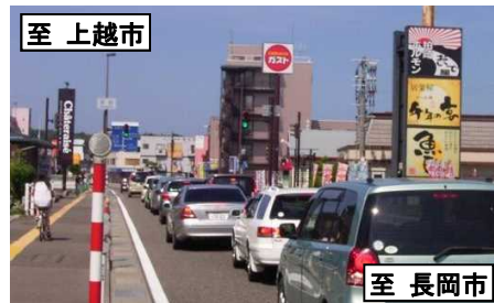
国道8号の混雑状況