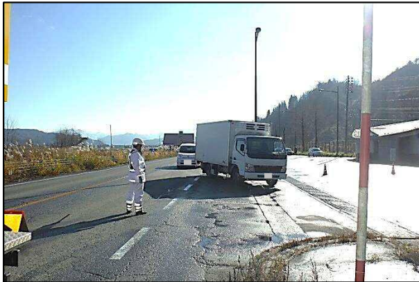
「チェーン装着指導訓練」の様子