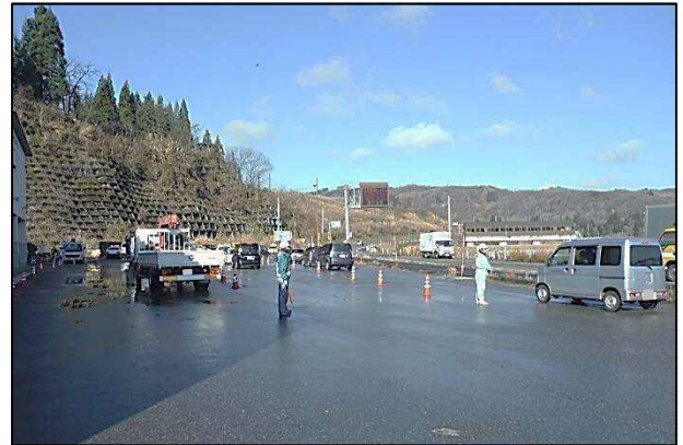
「チェーン装着指導訓練」の様子