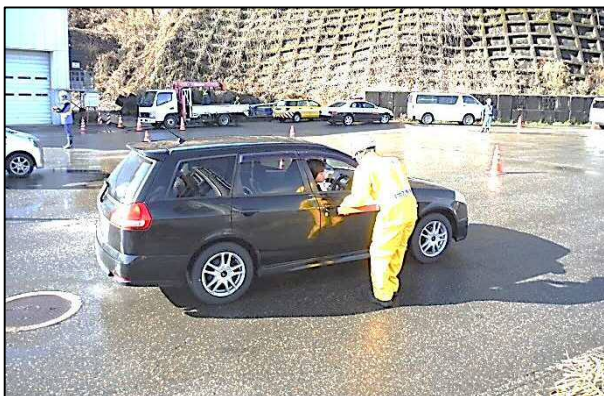
「冬期注意喚起チラシの配布」の様子