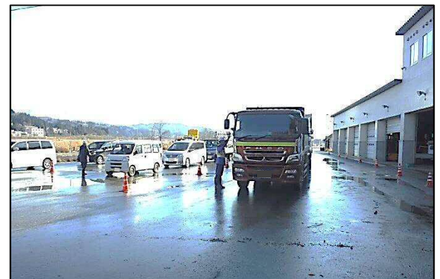
「冬用タイヤ装着率・チェーン携行率調査」の様子