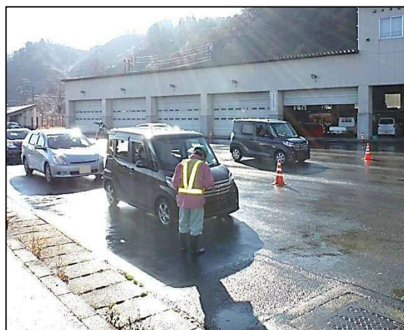
「冬用タイヤ装着率調査」の様子