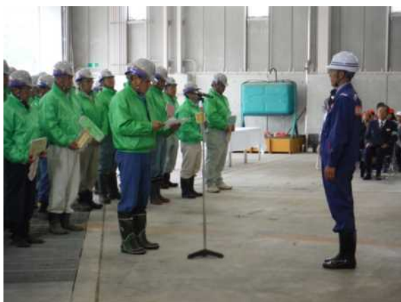
平成27年度 除雪出動式の状況