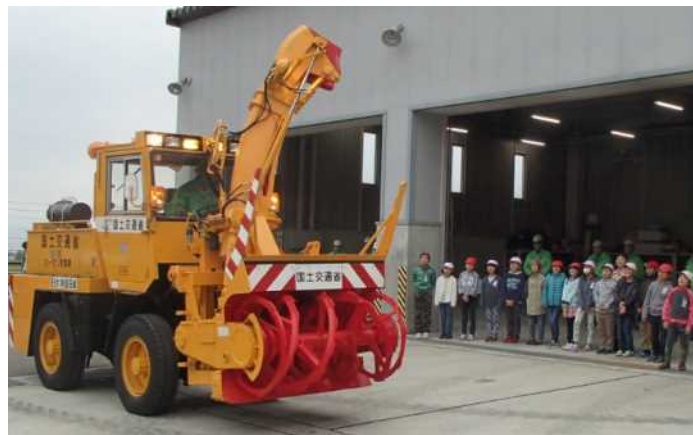
平成27年度 除雪機械デモンストレーションの状況