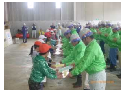
平成27年度 除雪出動式の状況