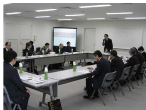
【昨年度の委員会の様子】