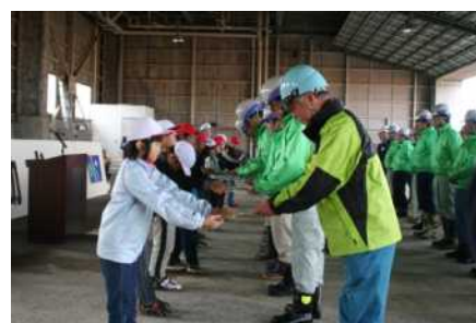
平成26年度 除雪出動式の状況

当日10時より除雪出動式会場で記者説明を行います。 駐車場を用意しますので、ご利用下さい。