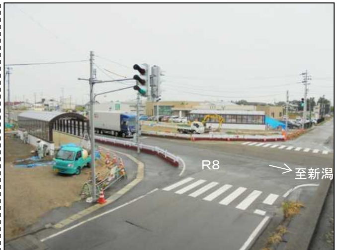
善久寺地下横断歩道施工状況