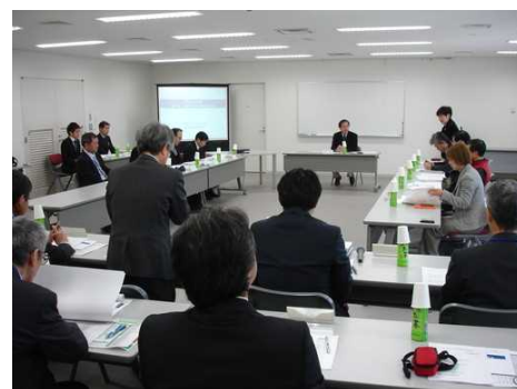
【昨年度の委員会の様子】

※委員会の冒頭撮影可、後日、議事概要を公開、審議内容については検討途中のものであり、非公開とさせていただきます。