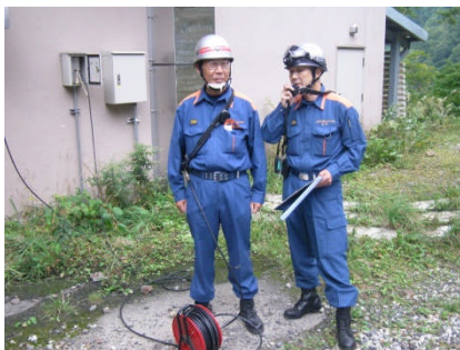
消防署員による通信訓練