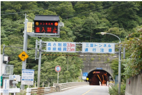
三国トンネル（群馬側）