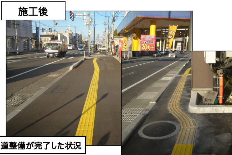
平成23年12月 上り線側の歩道整備が完了した状況

今回の現地立会と合わせ、昨年度に整備が完了した区間について、実際に視覚障害者の方々にご確認頂き、ご意見をお伺いします。