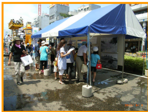
「パネル展示コーナー」の様子