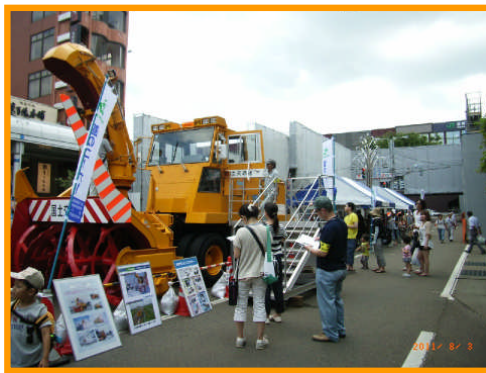
「ロータリ除雪車」展示・試乗の様子