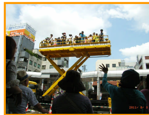
「高所作業車」展示・試乗の様子