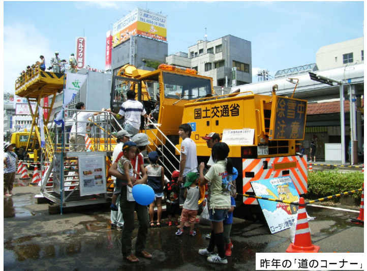
昨年の「道のコーナー」

日時：8月3日(金) 11:30～15:30 開設場所：長岡市大手通(長岡駅前) わんぱくお祭り広場内 (別紙を参照下さい) 開設概要：高所作業車の展示・試乗 ロータリ除雪車の展示・試乗 道路構造物の実物展示 パネル展示 道のクイズとアンケート 道の相談コーナー 主催：国土交通省長岡国道事務所 新潟県長岡地域振興局地域整備部 長岡市土木部 東日本高速道路(株)新潟支社長岡管理事務所 (社)北陸建設弘済会