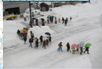
交通島に溢れる児童