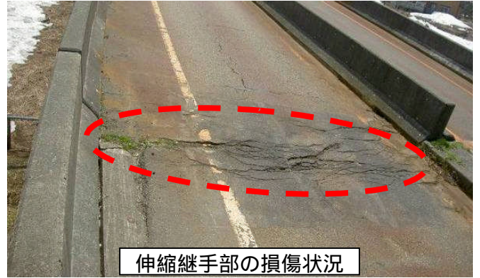
伸縮継手部の損傷状況