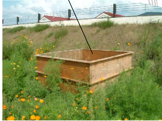
作成した堆肥枠：1. 8m四方・高さ1mのものを2つ(約3m 3 )