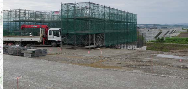
2009年度メキシコツイニングプログラム夏期研修時の八箇峠トンネル工事見学