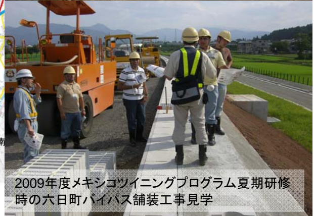
2009年度メキシコツイニングプログラム夏期研修時の六日町バイパス舗装工事見学