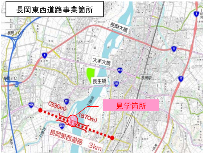
長岡東西道路事業箇所