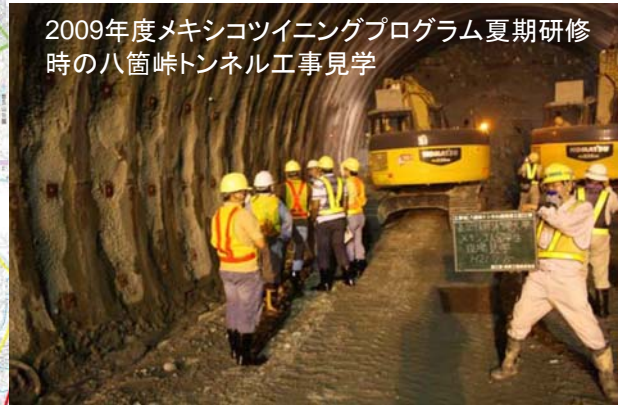
2009年度メキシコツイニングプログラム夏期研修時の八箇峠トンネル工事見学