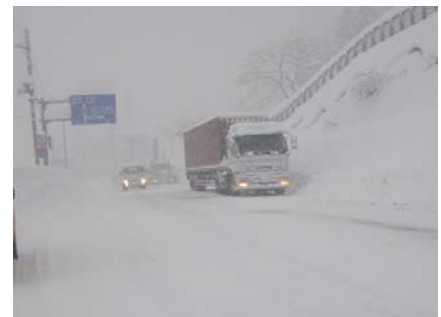
登坂不能車の写真(湯沢町堀切地内 H22年1月)

○冬用タイヤ未装着車のトラブルは、交通渋滞や交通事故の発生、除雪遅れの原因にもなりますので早めのタイヤ交換を！ 冬期道路交通の確保にご協力をお願いします。