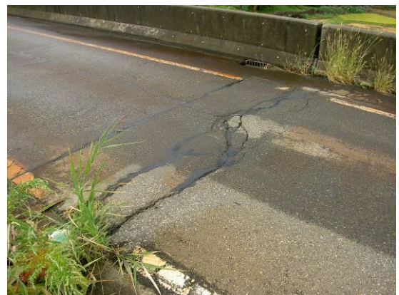
舗装・伸縮継手部の損傷