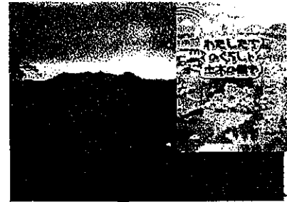
山古志地域道路除雪