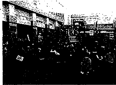
小学校で開催の除雪学習会