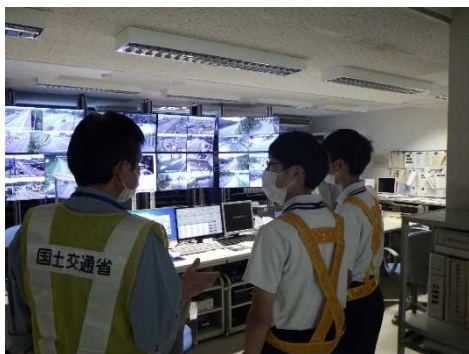
【道路情報管理室見学】