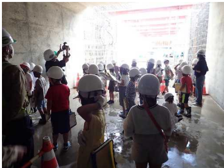
【建設中の地下道から間近で見学】