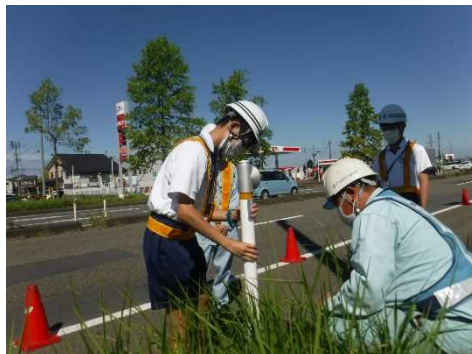
【視線誘導標取り替え作業を体験】