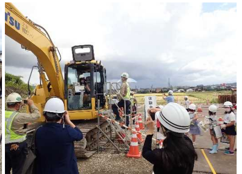
【建設機械の乗車を体験】