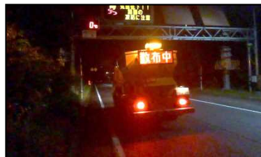
初めて凍結防止剤の散布