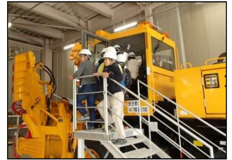
除雪車への試乗体験