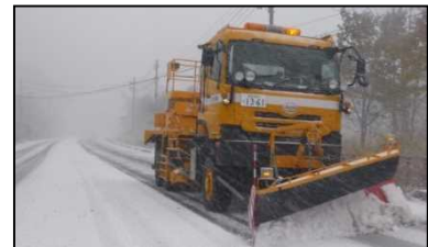
初めての除雪車出動