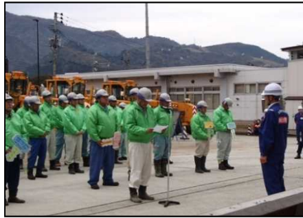
除雪業者による決意表明