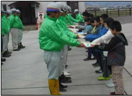
メッセージが添えられた鍵の手渡し

出動式では、除雪業者へ児童の激励のメッセージが添えられた鍵が手渡され、除雪業者からは「今冬も安全かつ円滑な交通確保のために24時間体制で頑張ります」との決意表明がありました。出動式終了後は除雪車への試乗等の体験学習を行いました。