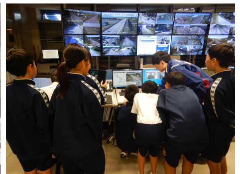
【説明を熱心に聞く生徒たち】